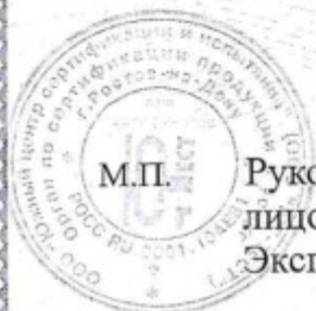
Схема сертификации - 2. Плановый инспекционный контроль - один раз в год.